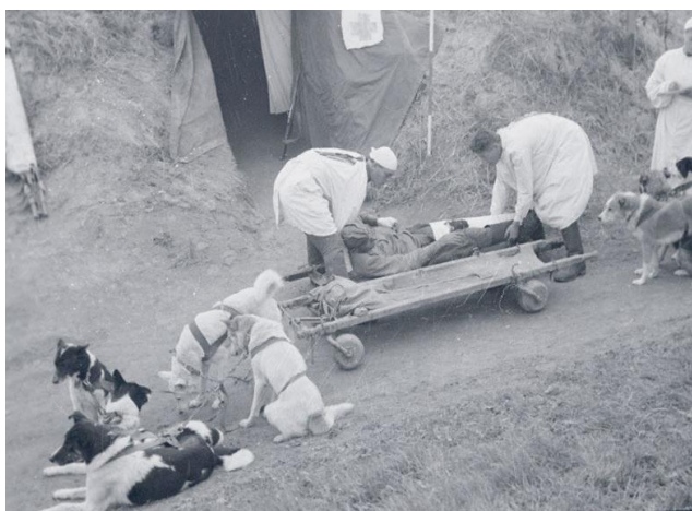
На фото: действующая армия, транспортировка раненых на санитарных повозках, запряженных собаками.