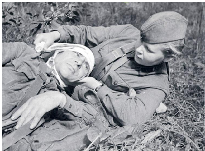
На фото: сандружинница перевязывает раненого бойца на поле боя.