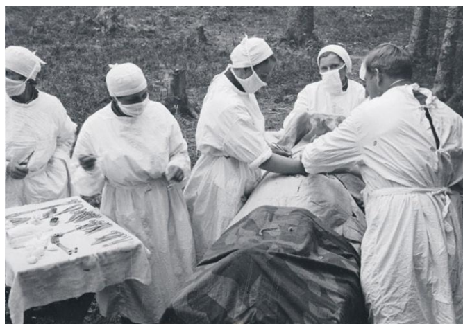
На фото: действующая армия, развернутая в лесу операционная