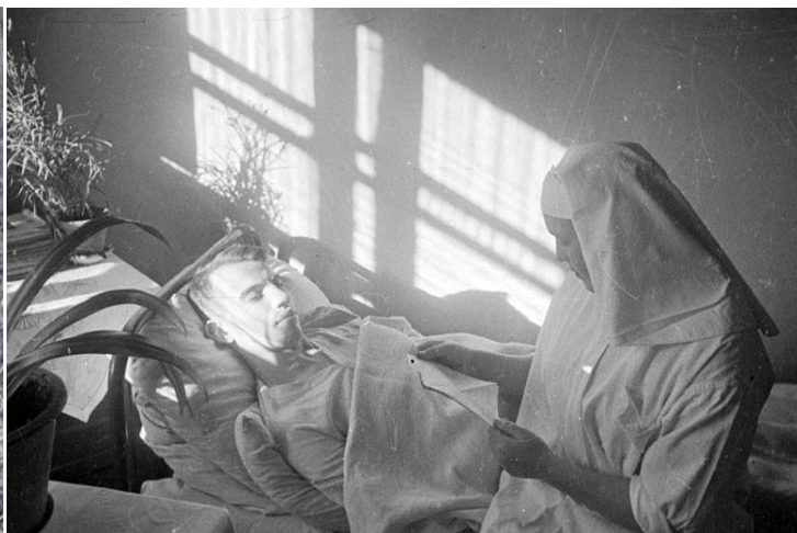
На фото: медсестра военного госпиталя читает письма раненому солдату.